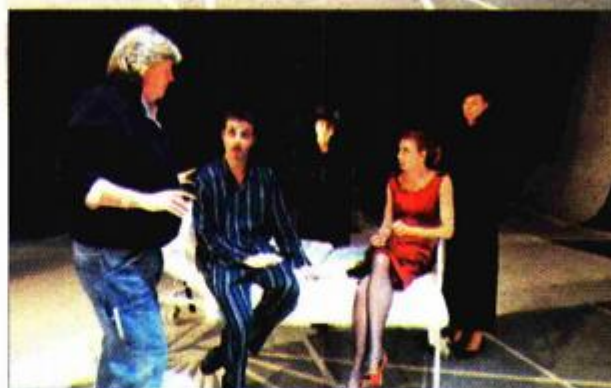
Ekipa razrađuje strategiju