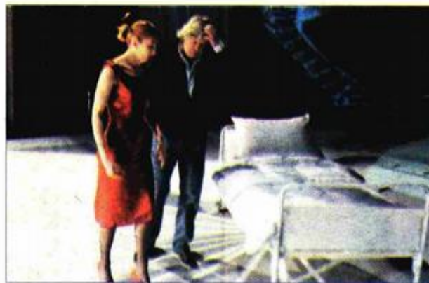
Predstava je nastala prema Tomizzinom romanu »Posjetiteljica«